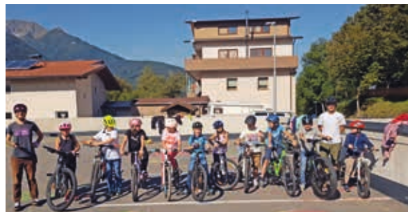
Radfahrkurs am Parkdeck