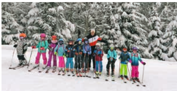
Skikurs im Februar