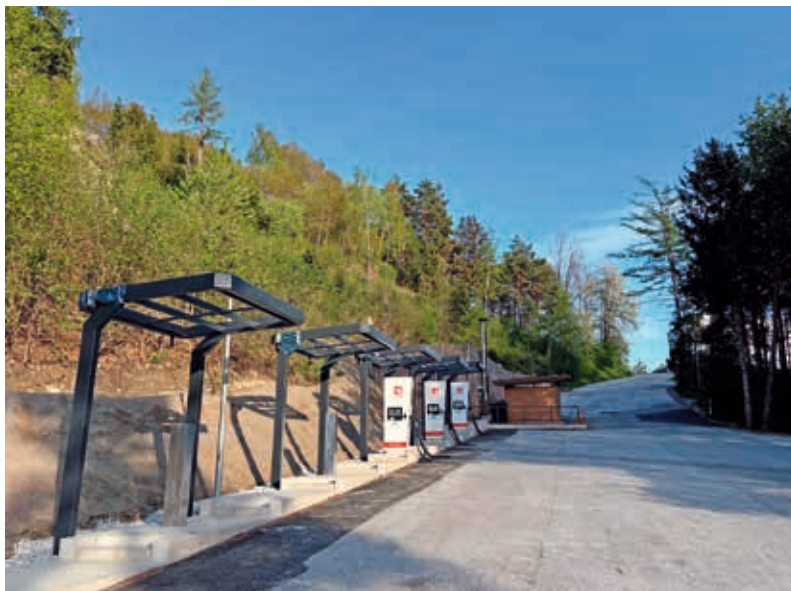
Ladestationen am Parkplatz Europabrücke

Im Laufe des Aprils sind auf den Dächern von Lanz, McDonald's und Rasthaus Europabrücke Photovoltaikanlagen mit zusammen 100 kWp in Betrieb genommen worden. Der produzierte Solarstrom deckt den durchschnittlichen Jahreseigenbedarf jedenfalls ab. Ein weiterer Meilenstein ist, dass zu den bestehenden fünf E-Ladestationen vor der Raststätte Lanz am unteren Europabrückenparkplatz sechs weitere mit jeweils 300 kW dazu gekommen sind. Der Betreiber „e-laden Tirol“ nahm sie am 1. April in Betrieb. Im Endausbau wären noch weitere acht Ladestationen möglich.