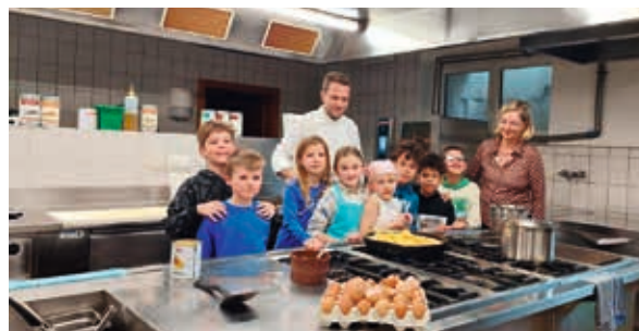
Besuch im Gasthof Handl